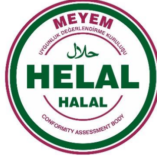
Şekil B: MEYEM Helal Logosu